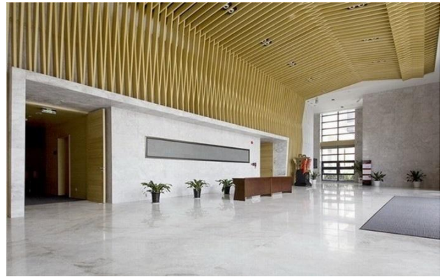
北大光華管理學院：素雅的雅高大理石和象牙塔內的潔淨空間相互滲透，營造出濃鬱的書香氛圍。