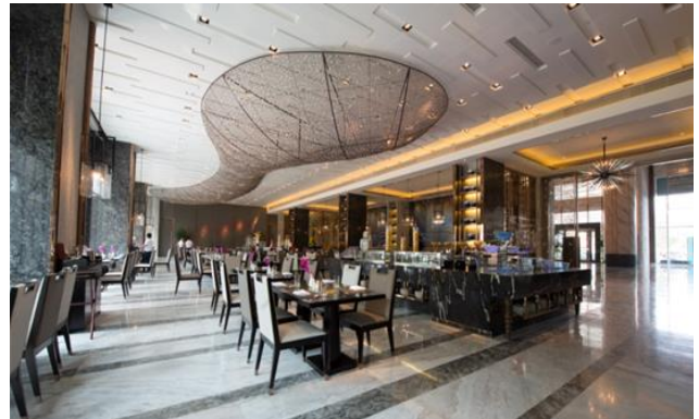
南寧萬達文華酒店：牆面、地面被雅高錦玉系列產品大篇幅渲染，營造出建築的特殊美感。