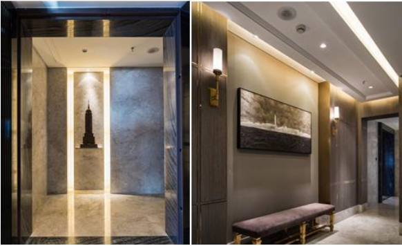
上海萬科翡翠濱江：採用雅柏灰大理石整面鋪貼，自然紋理和灰白色調營造出自然優雅空間。